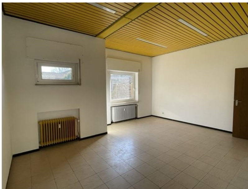
Blick in das Ladenlokal