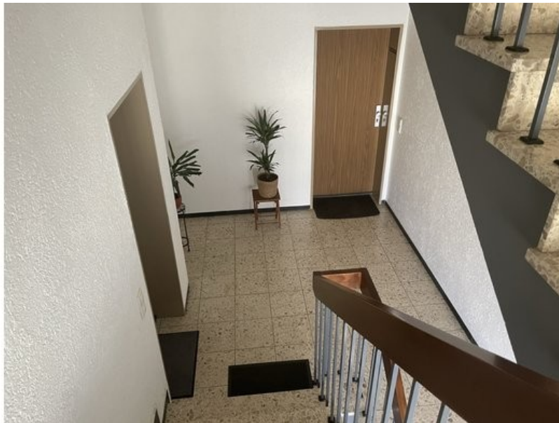
Blick in das gepflegte Treppenhaus