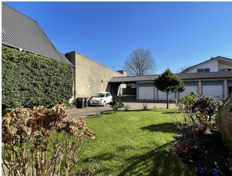
Blick in den Hinterhof mit den Garagen und Stellplätzen