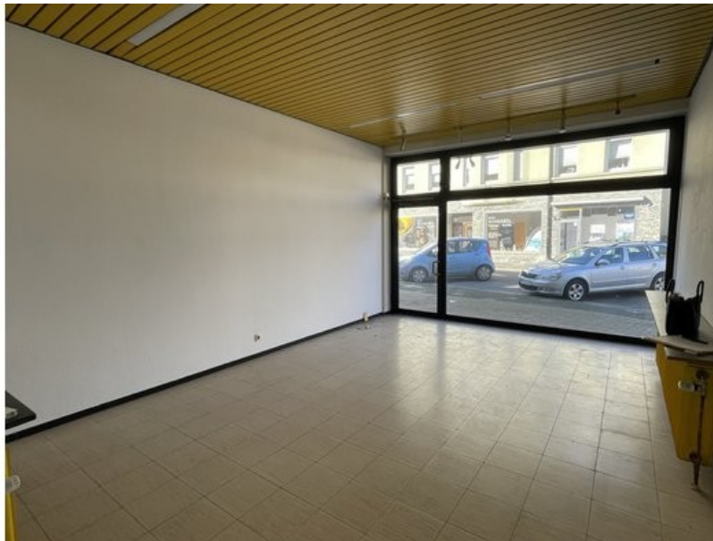
Verkaufsbereich im Ladenlokal