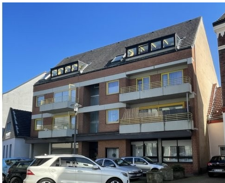
Vorderseite des Hauses