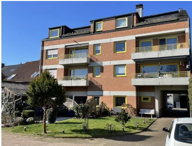
Die Rückseite des Hauses